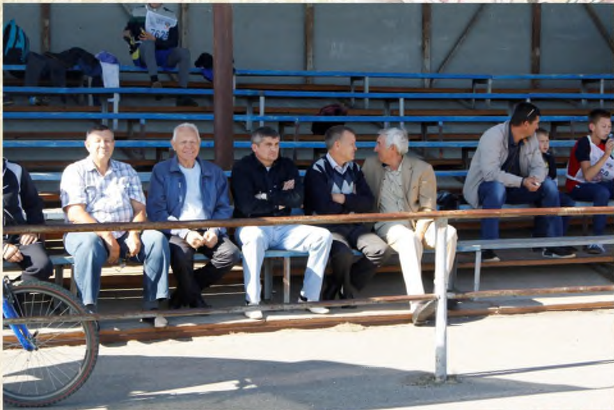
Соревнования по футболу