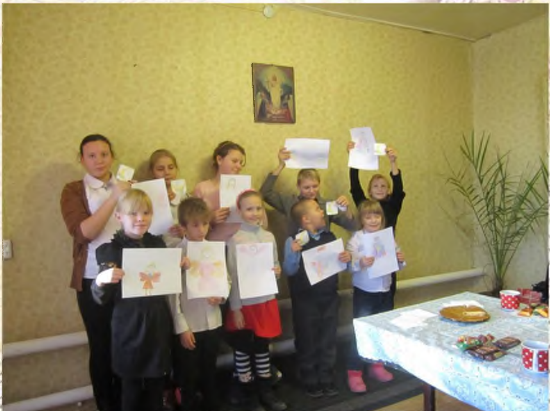
Мероприятие ко дню матери «Крылья ангела»