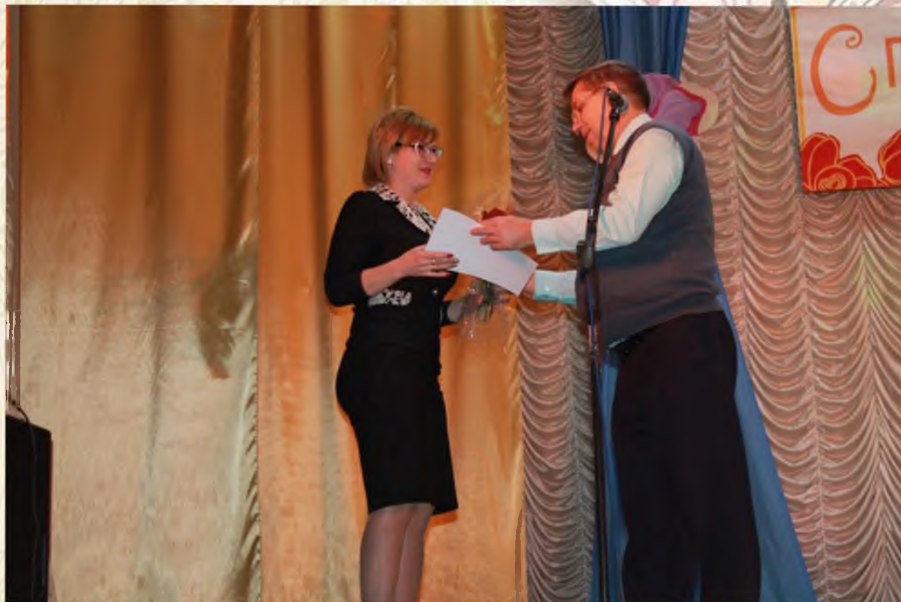
Поздравление сотрудников ЗАГС со 100-летним юбилеем