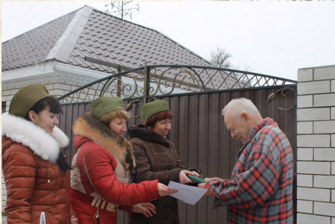
Поздравление с 23 февраля Председателя Совета депутатов