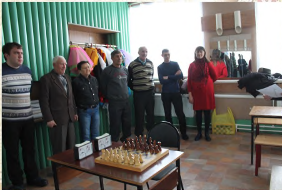
Шахматно – шашечный турнир