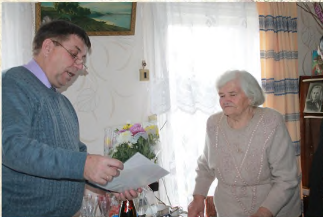
Поздравление с 90-летним юбилеем