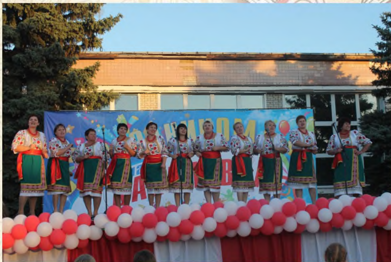
Празднование 270-ление р.п.Даниловка