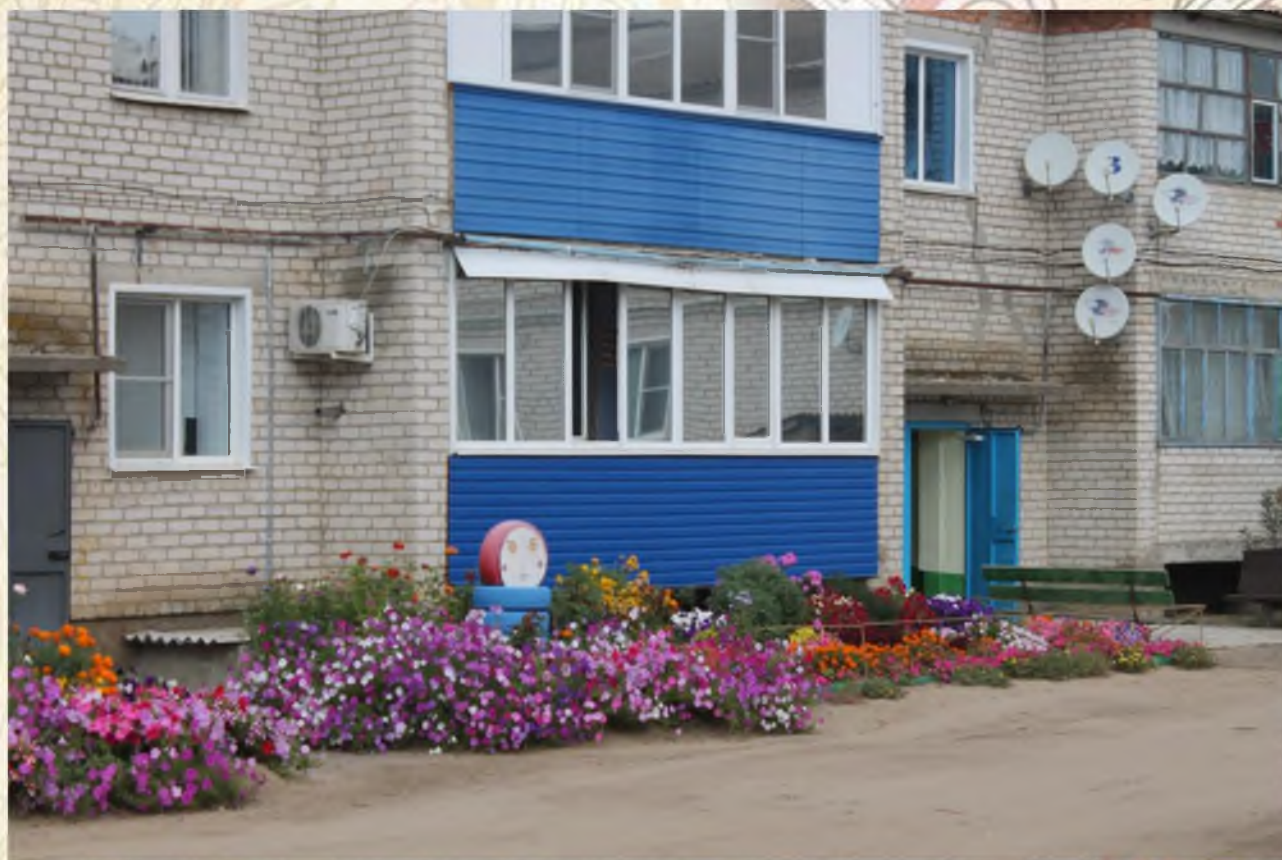
Конкурс по благоустройству придомовой территории