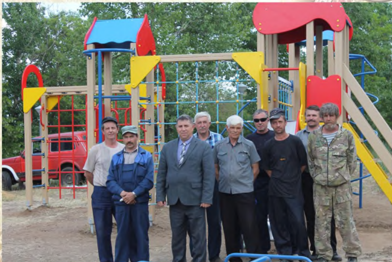
Установка детской площадки