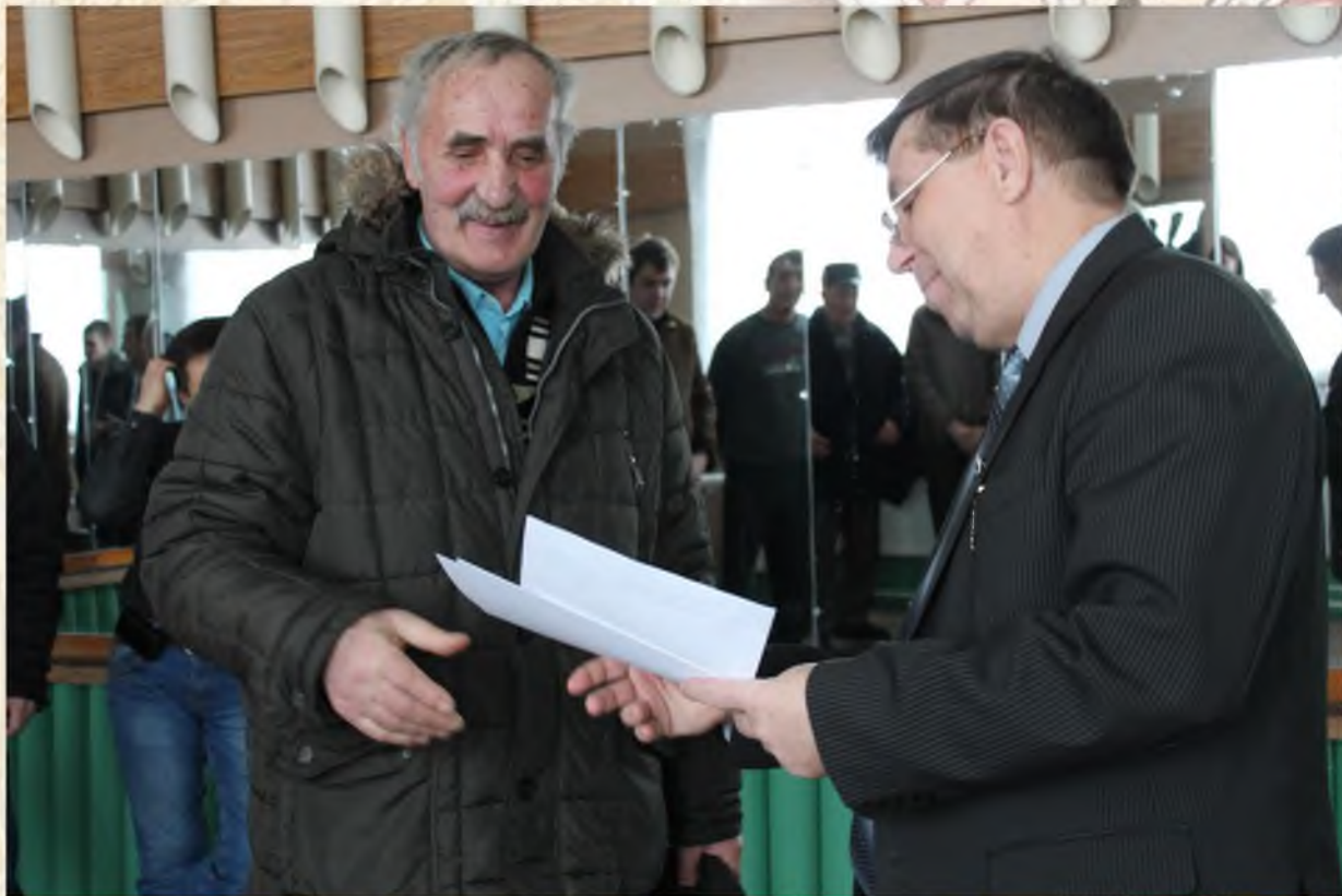
Награждение участников шахматно-шашечного турнира