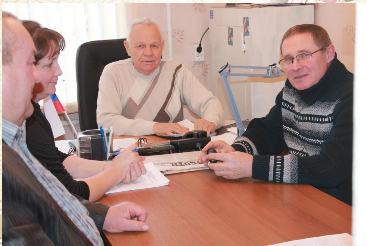
Заседание бюджетной комиссии

Проведено 1 заседание и рассмотрен 1 вопрос постоянной комиссия Совета депутатов городского поселения р.п.Даниловка по законности, соблюдению прав граждан, организации местного самоуправления, регламенту и депутатской этике по контролю за достоверностью сведений о доходах, расходах, об имуществе и обязательствах имущественного характера, представляемых лицами, замещающими муниципальные должности.