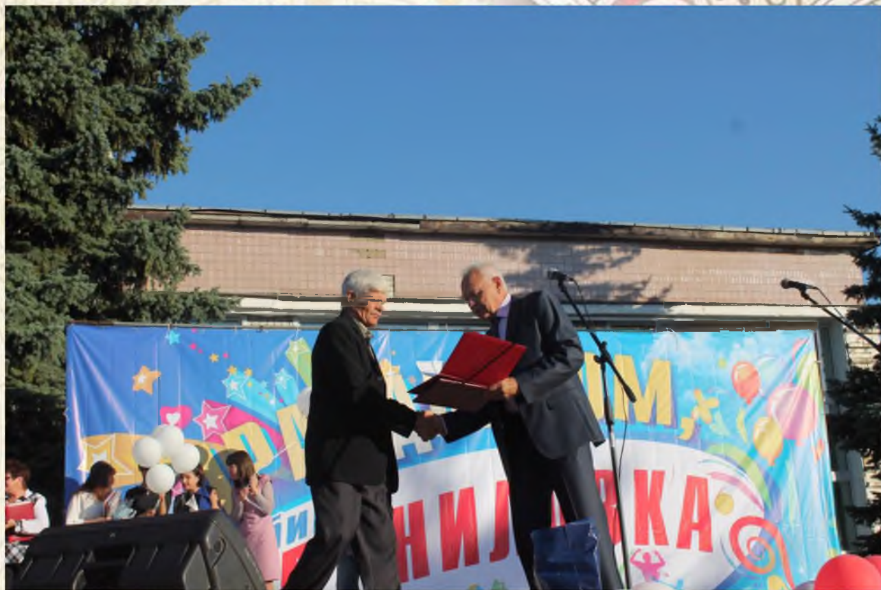
Вручение Почетных грамот Волгоградской областной Думы