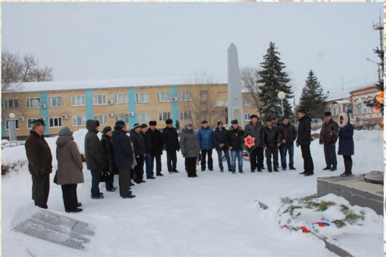
Митинг, посвященный выводу Советских войск из Афганистана