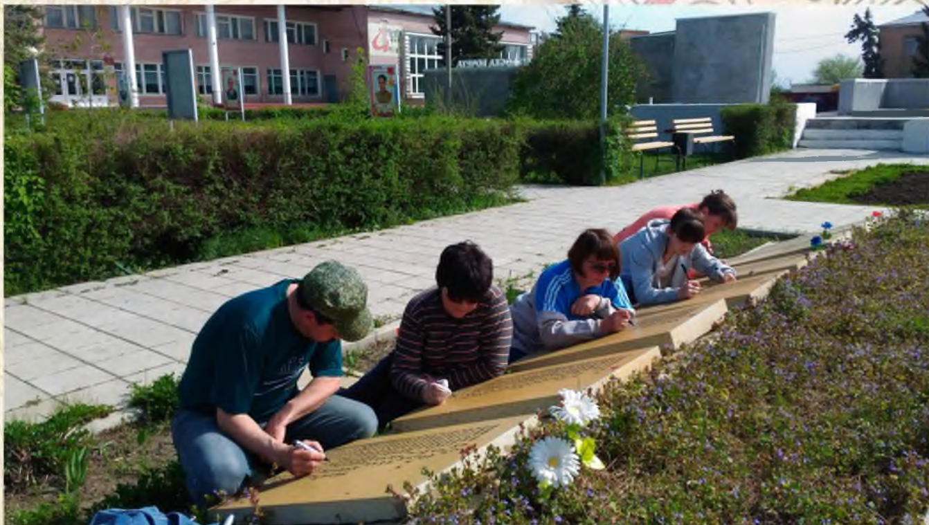
Проведение субботника, в честь года экологии