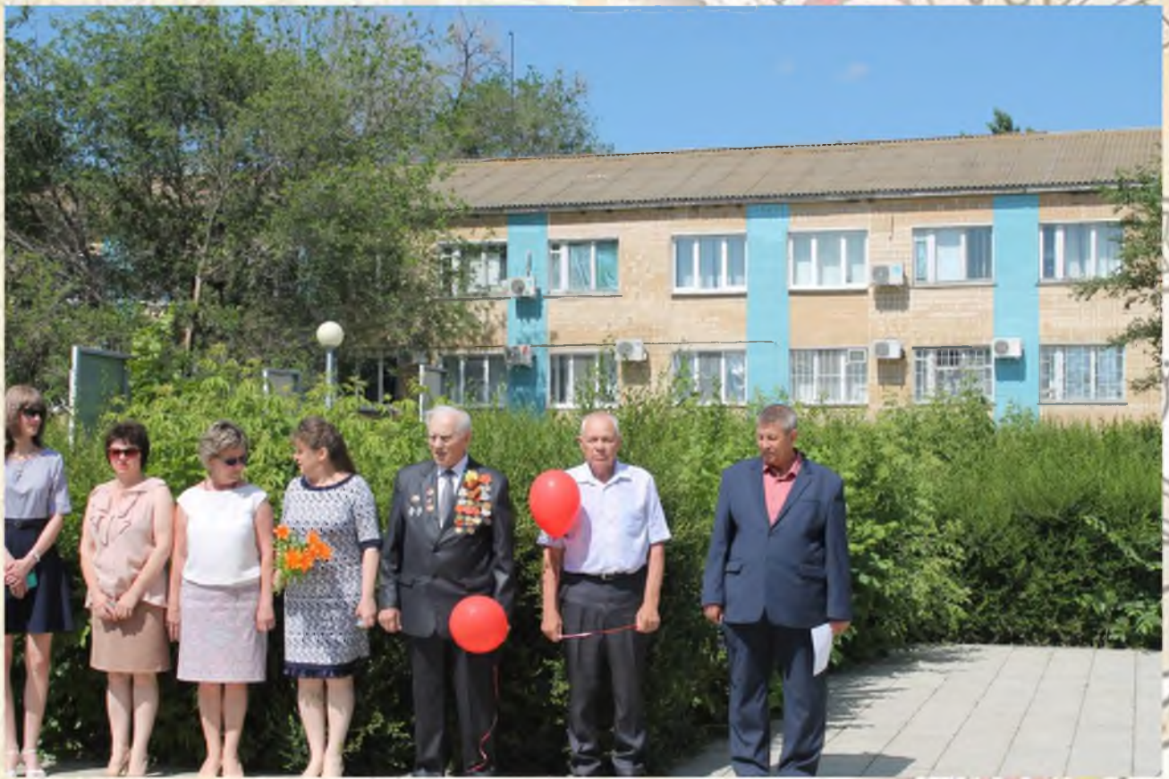
Митинг, посвященный Дню памяти скорби 22.06.2017 г.