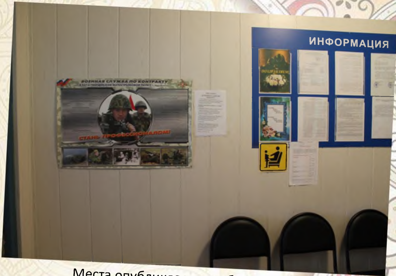
Места опубликования, обнародования