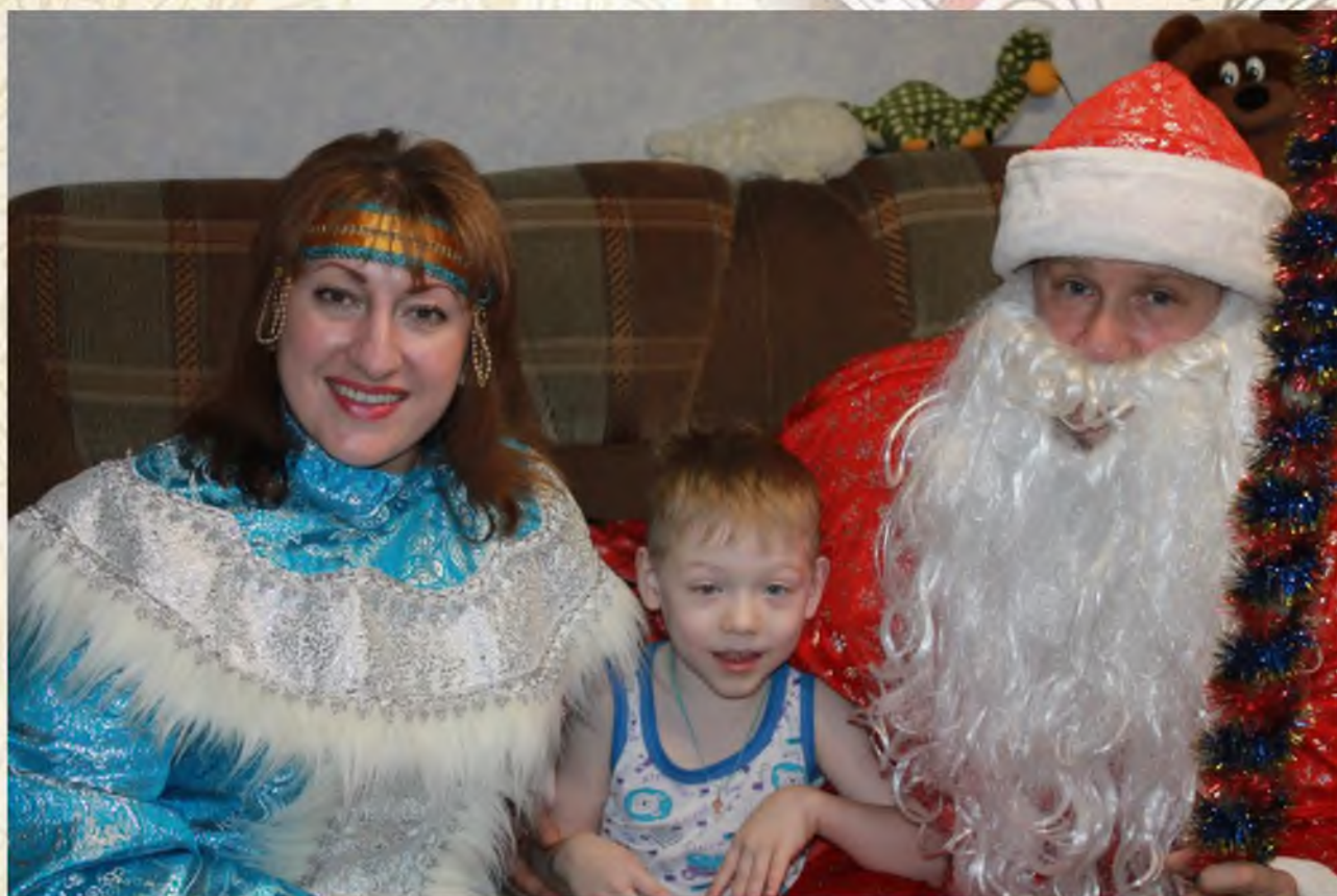
Поздравление детей – инвалидов с Новым годом