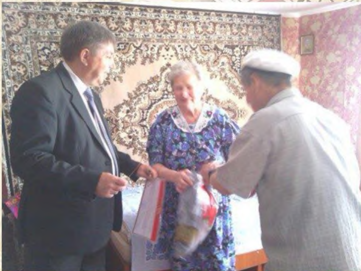
Поздравление с 90-летним юбилеем