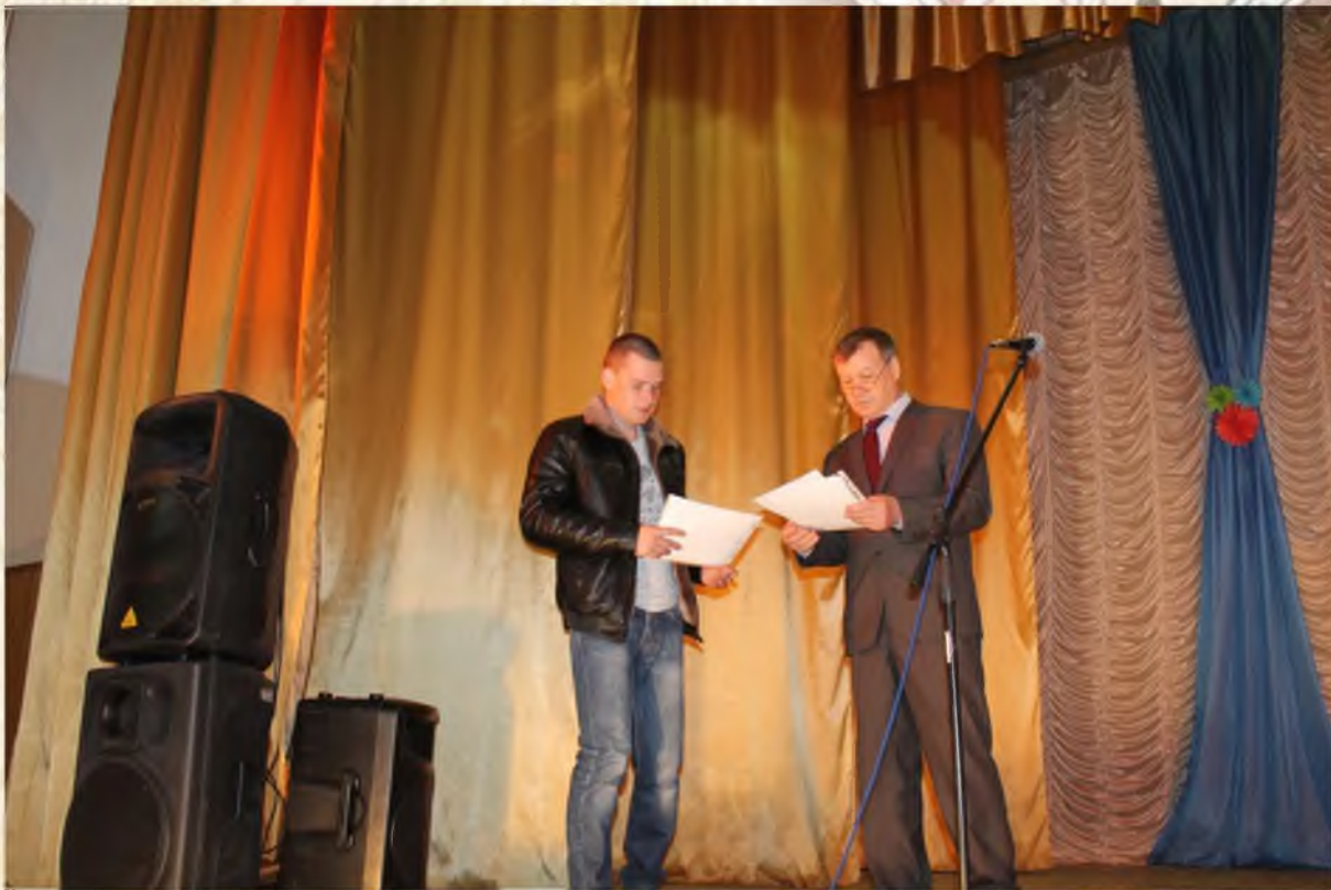
День работников бытового обслуживания и ЖКХ