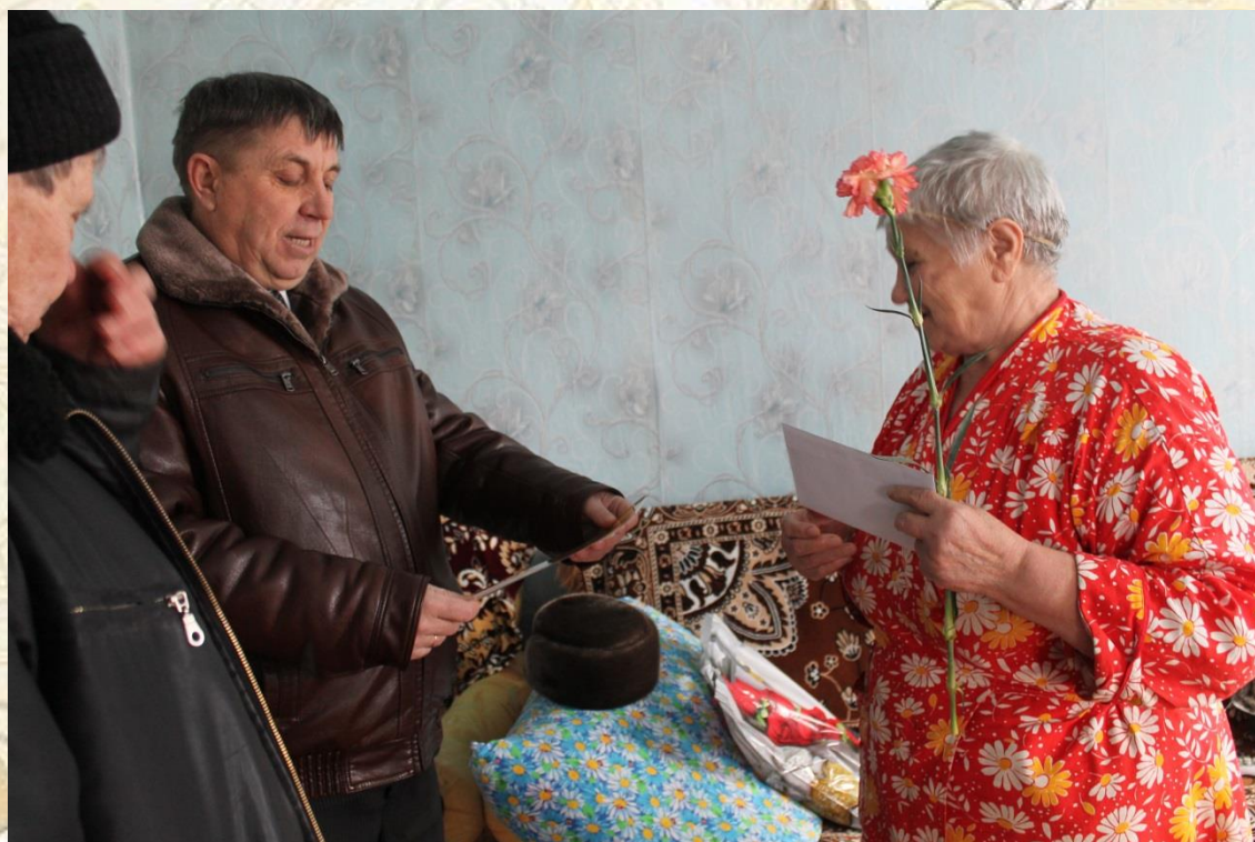
Поздравление с 74-ой годовщиной Победы в Сталинградской битве