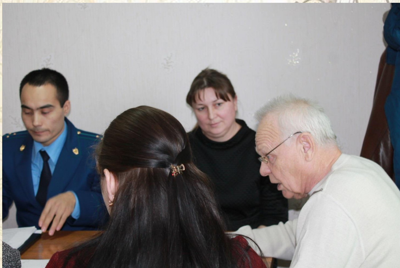
Заседание Совета депутатов городского поселения р.п.Даниловка

В 2017 году было проведено 16 заседаний Совета депутатов 3-им созывом, всего принято 65 решений, из них 25 нормативно-правовых акта.