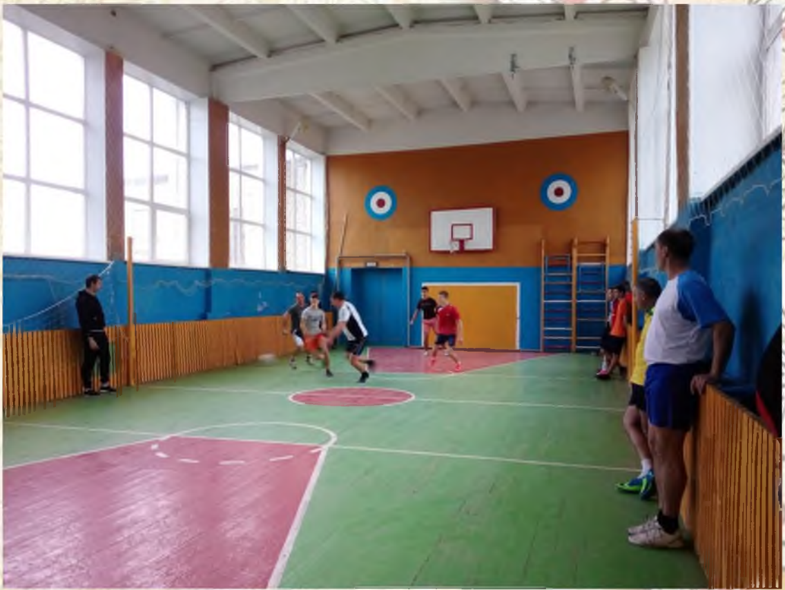
Проведении мини-футбола ко Дню отца