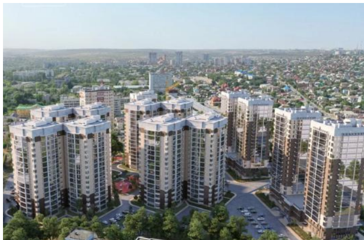
ЖК "Гранд Авеню"