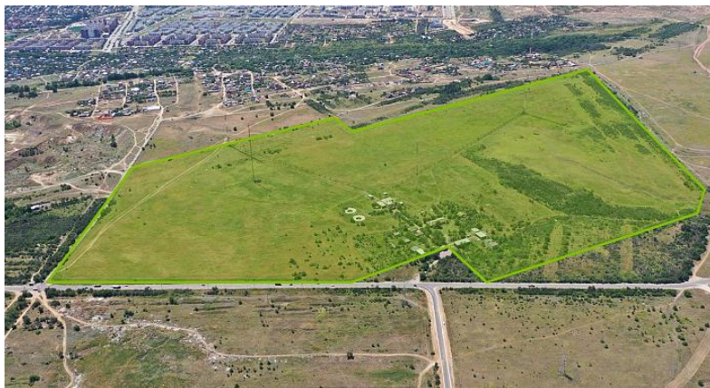
Волгоград, Советский район, ул.Казакская 59 – 77,7 га.