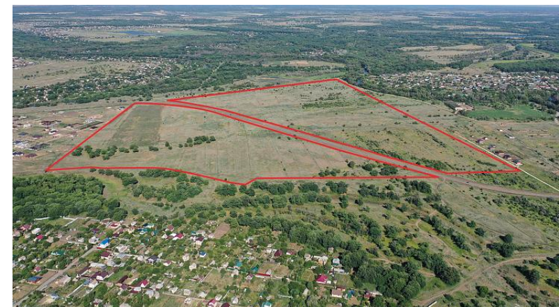
Волгоградская область, г.Краснослободск – 77,5 га.