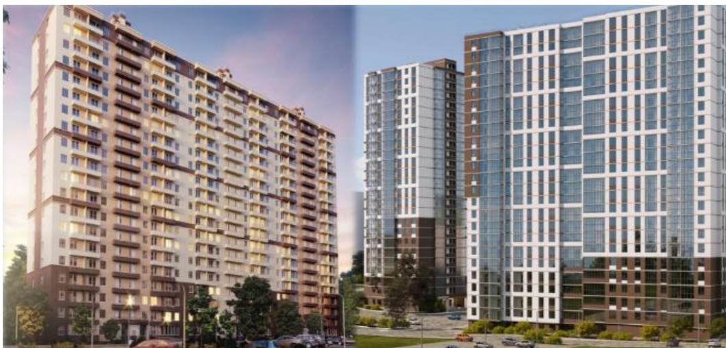
ЖК Шоколад и ЖК Квартал Московский