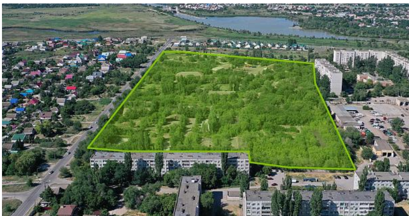
Волгоград, Красноармейский район, ул.Столетова 57 и 57а – 12,4 га.

4 площадки КРТ 3 в Волгограде 1 в Краснослободске