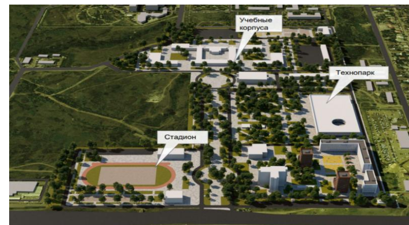
Волгоград, Советский район, пр. Университетский 100 – 8,9 га.