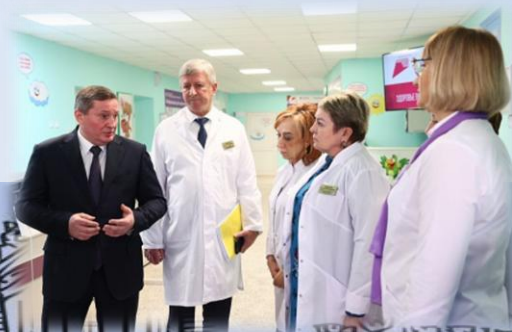
Реконструкция детской поликлиники № 2 города Волжского