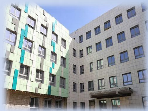
Строительство поликлиники больницы №16 в Красноармейском районе Волгограда