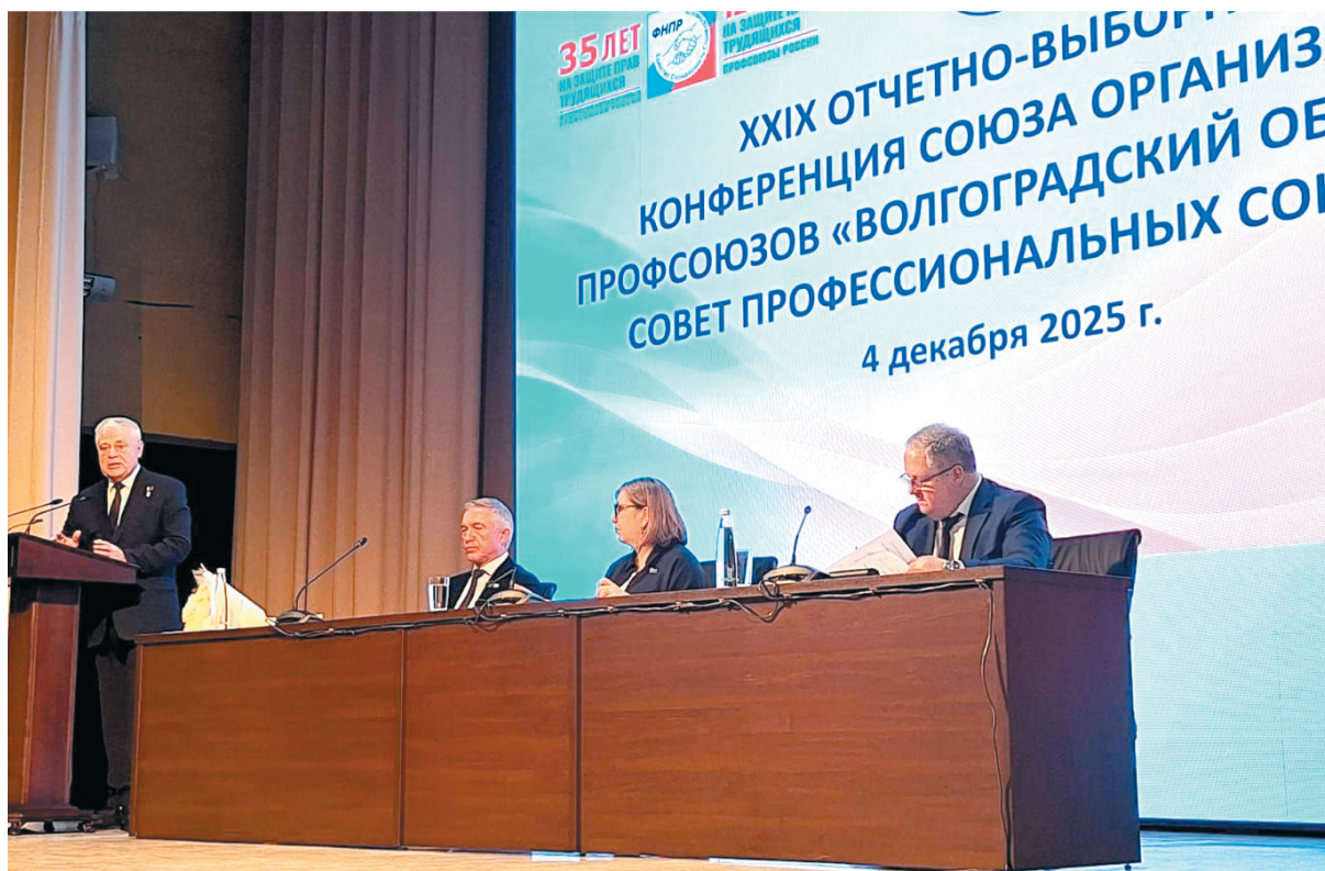
Участие в отчетно-выборной конференции Волгоградских профсоюзов