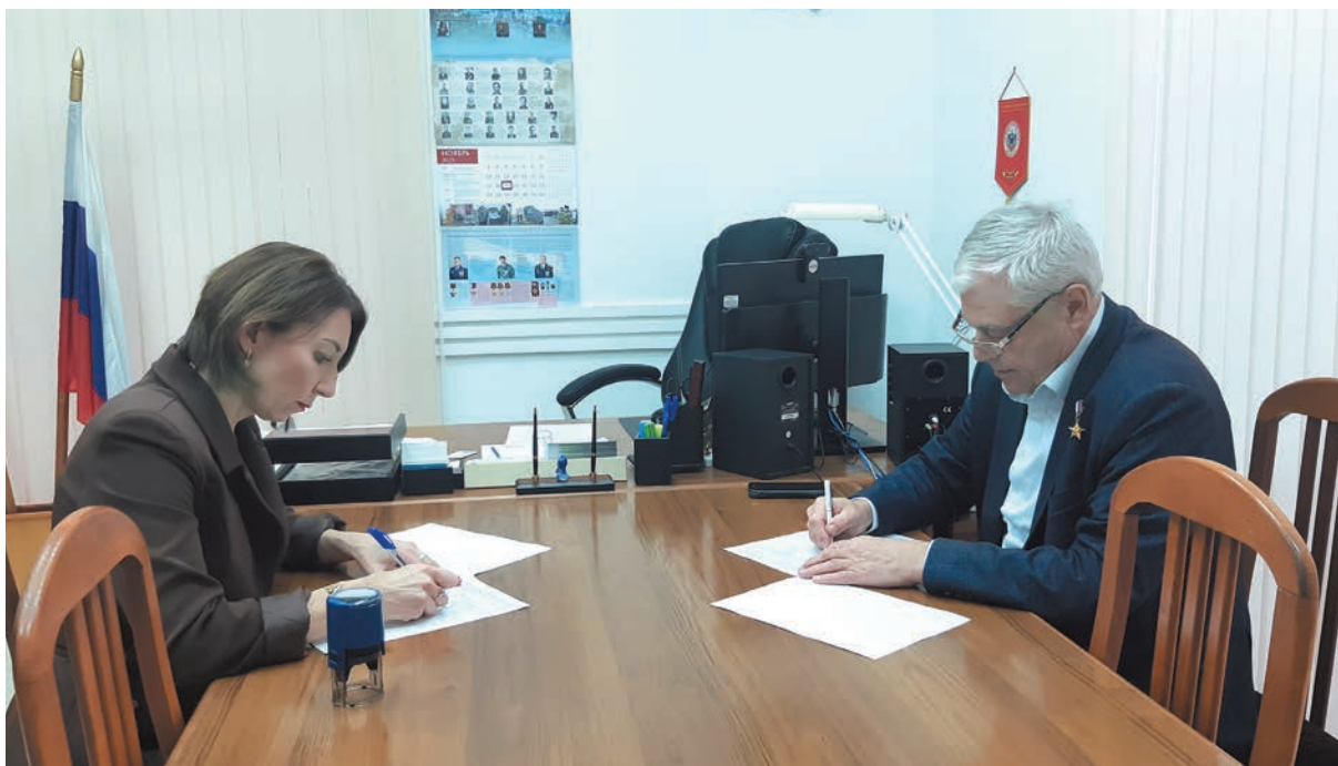
Заклучение Соглашения о сотрудничестве с вузом Волгоградский институт бизнеса