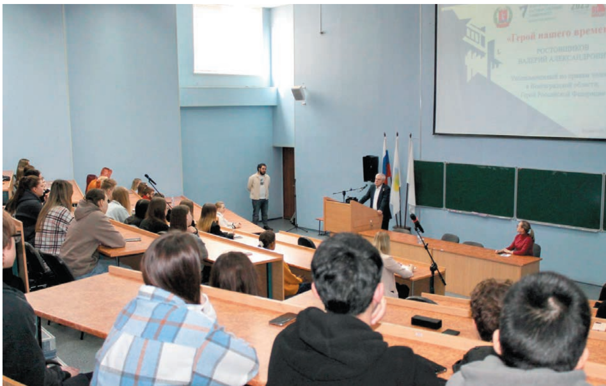
Выступление перед студентами