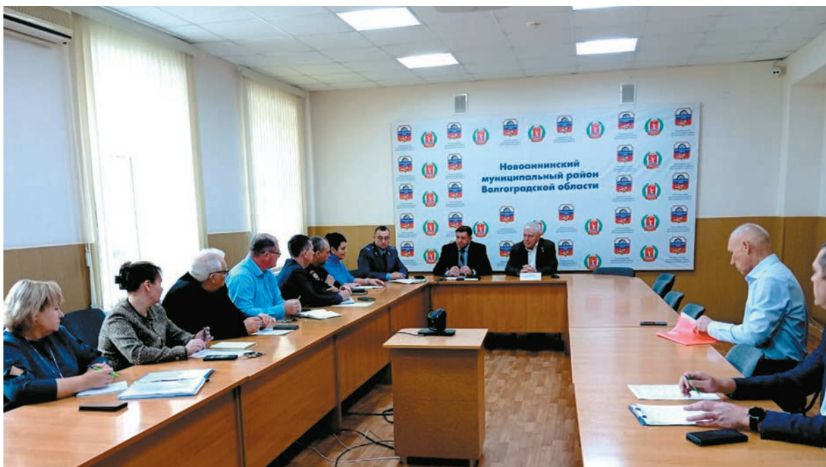
Личный прием граждан в Новоаннинском районе