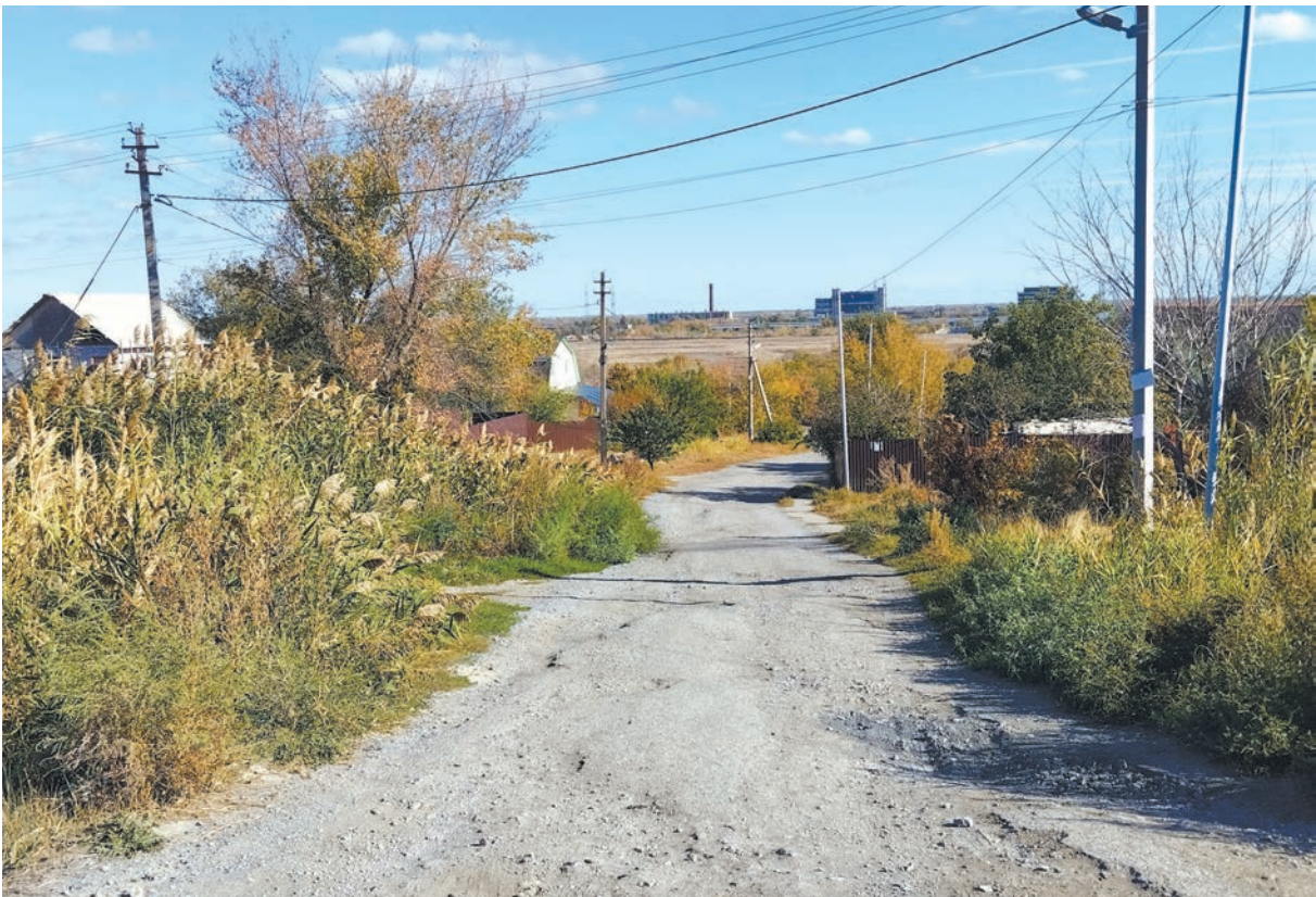
Длительное отсутствие благоприятных условий проживания в ЖК Импульс Кировского района Волгограда