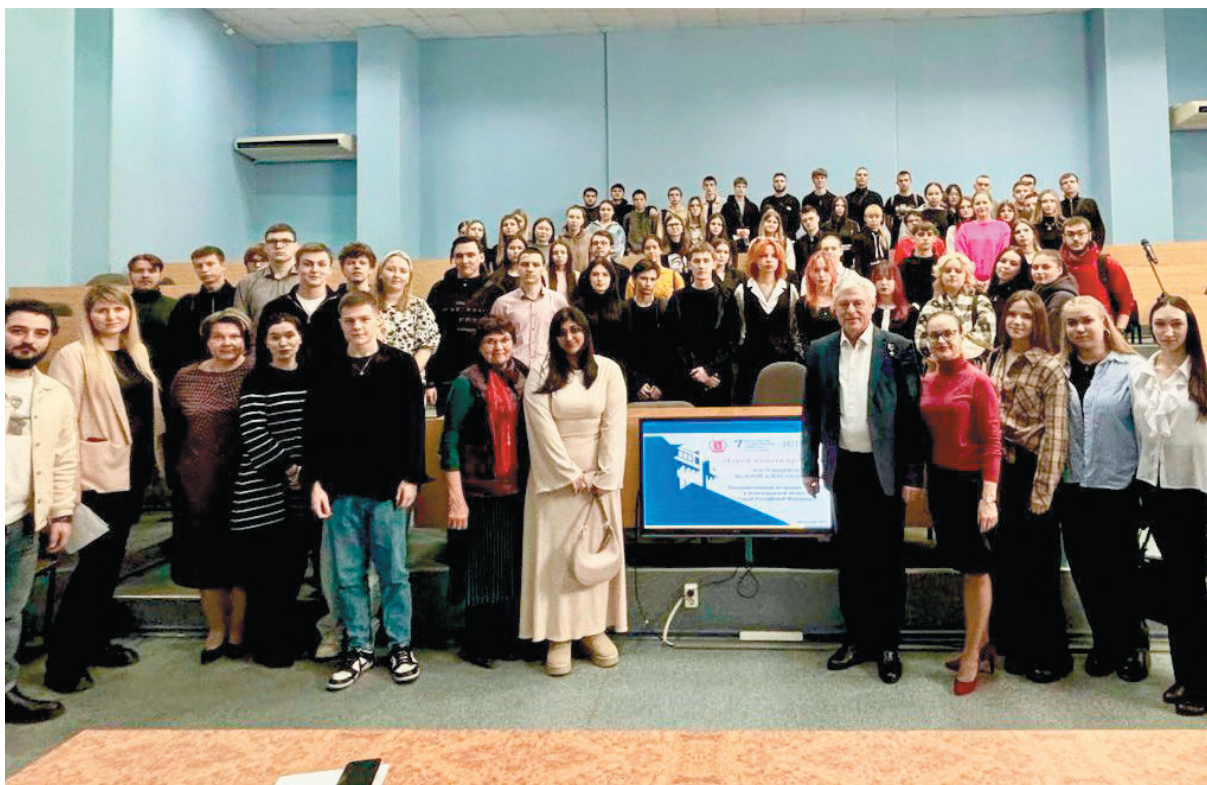
Выступление перед студентами ВолГУ