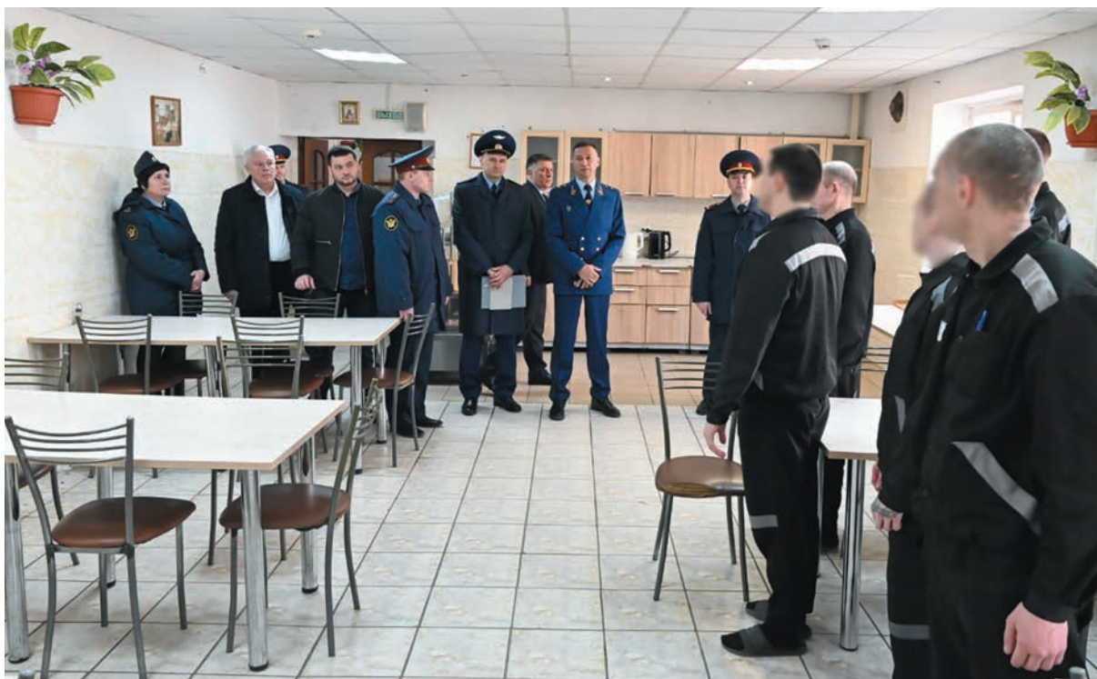
Посещение исправительного учреждения