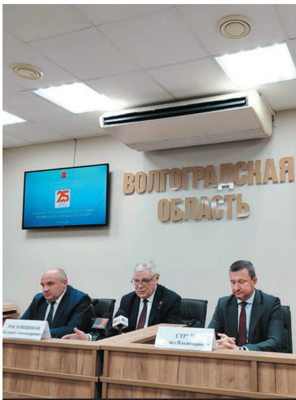
Подведение итогов правозащитной деятельности