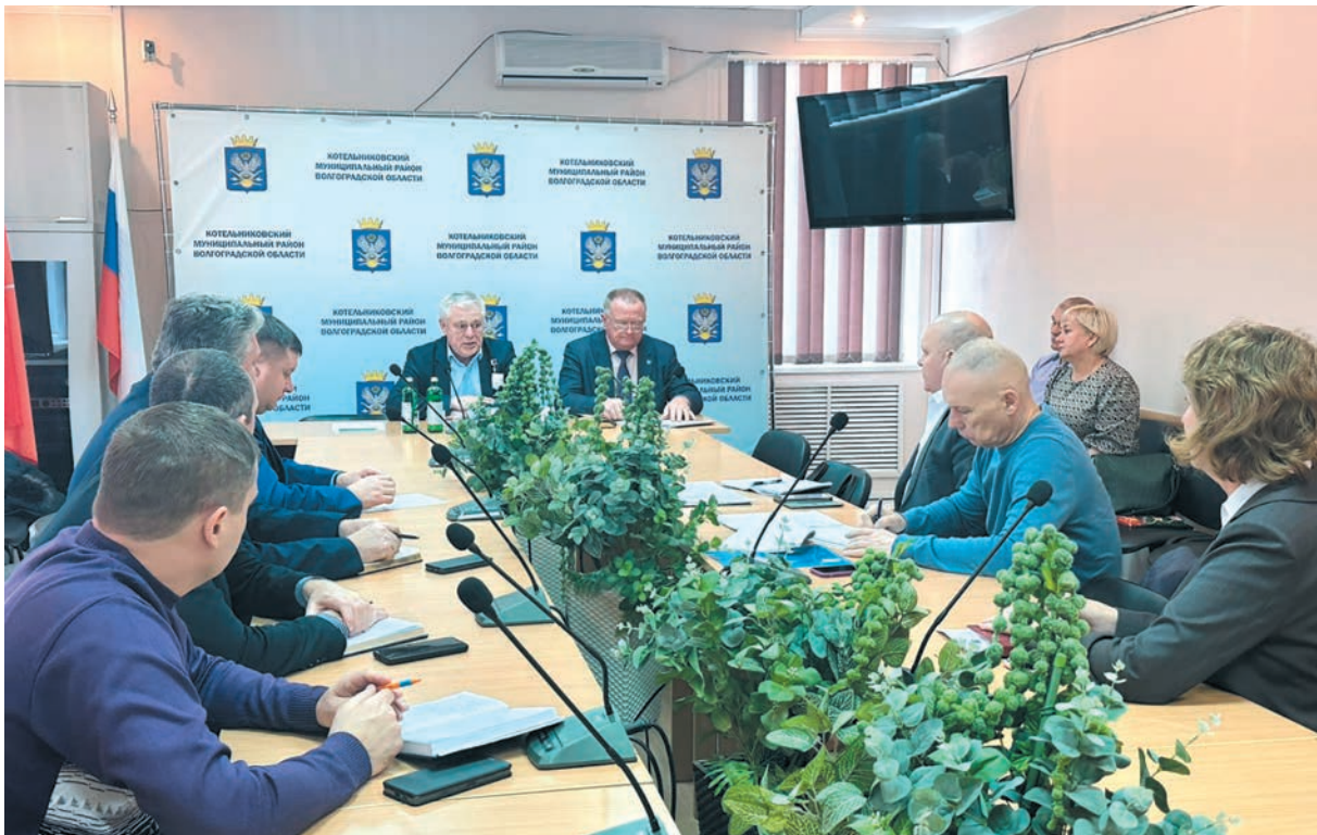
Личный прием граждан в Котельниковском районе