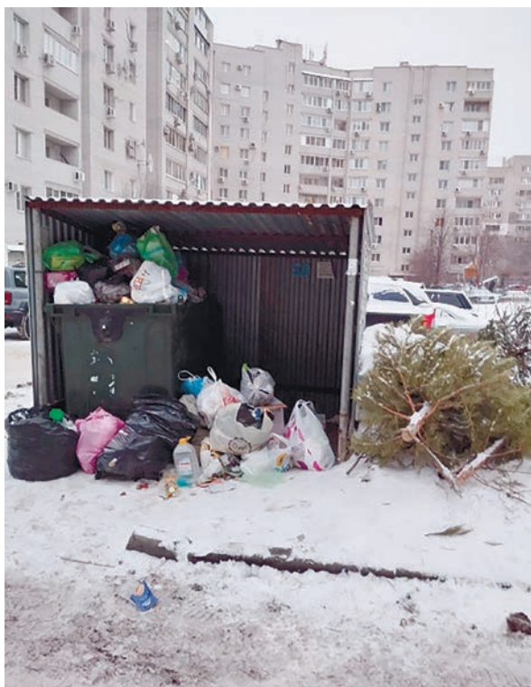
Незаконно размещенная контейнерная площадка (г. Волгоград, ул. Днестровская, 12)