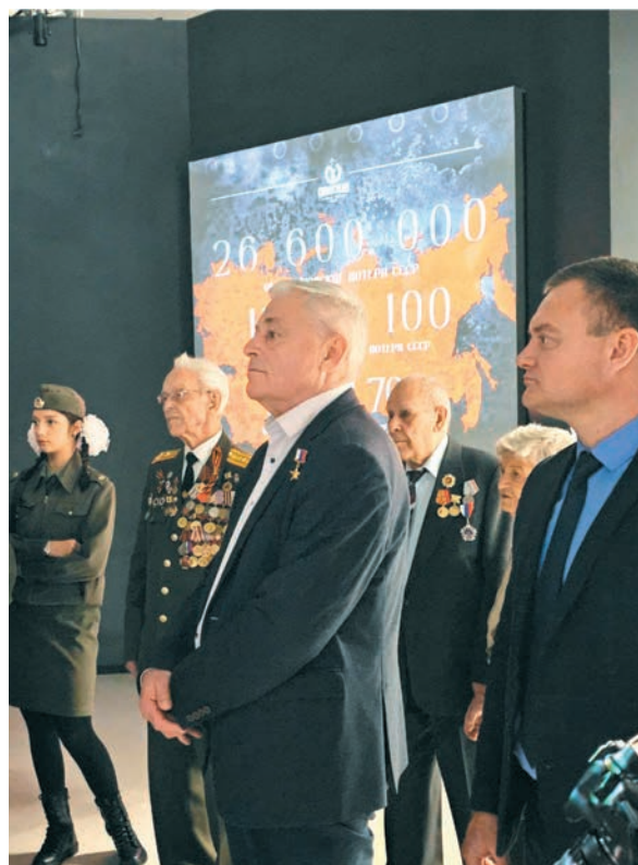
Открытие мультимедийной выставки