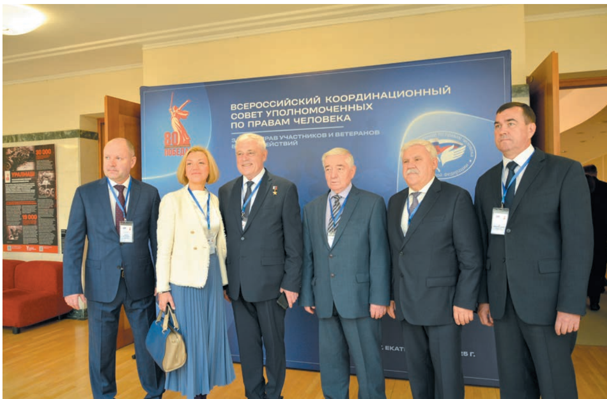
Всероссийский Координационный совет Уполномоченных по правам человека «Защита прав участников и ветеранов боевых действий» - май 2025 года, г. Екатеринбург