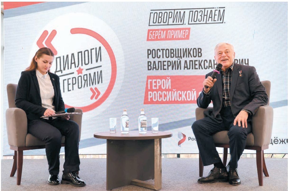
На встрече с Героем России