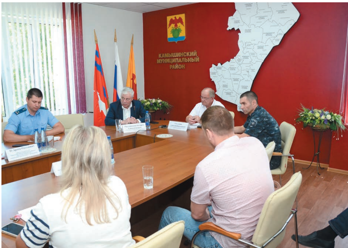
Личный прием граждан в г. Камышине