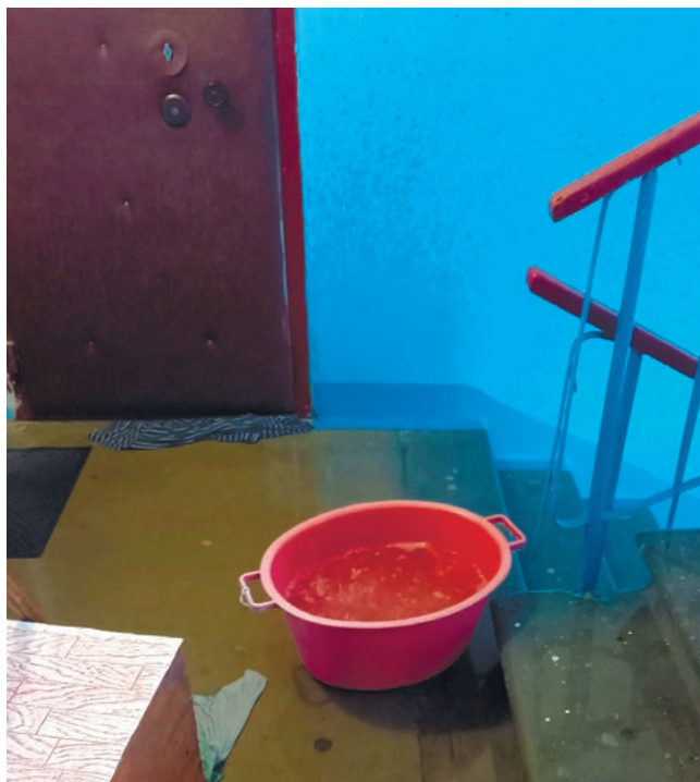
Жители девятиэтажки вынуждены пресекать затопление подвала тазиками