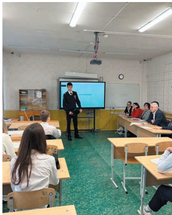
Правозащитный конкурс учащихся «Права человека глазами ребенка»