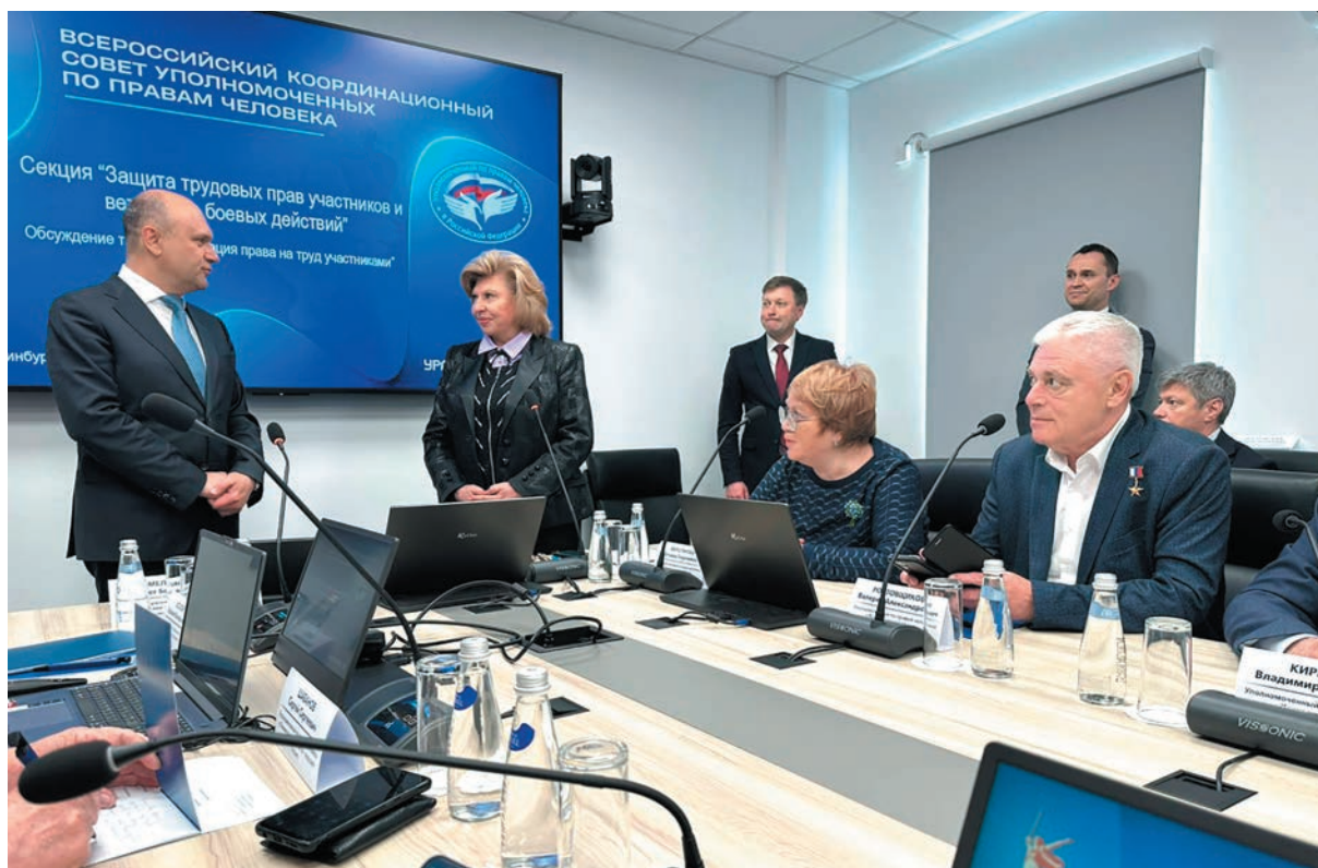
Всероссийской Координационный совет Уполномоченных по правам человека «Защита прав участников и ветеранов боевых действий» - май 2025 года, г. Екатеринбург