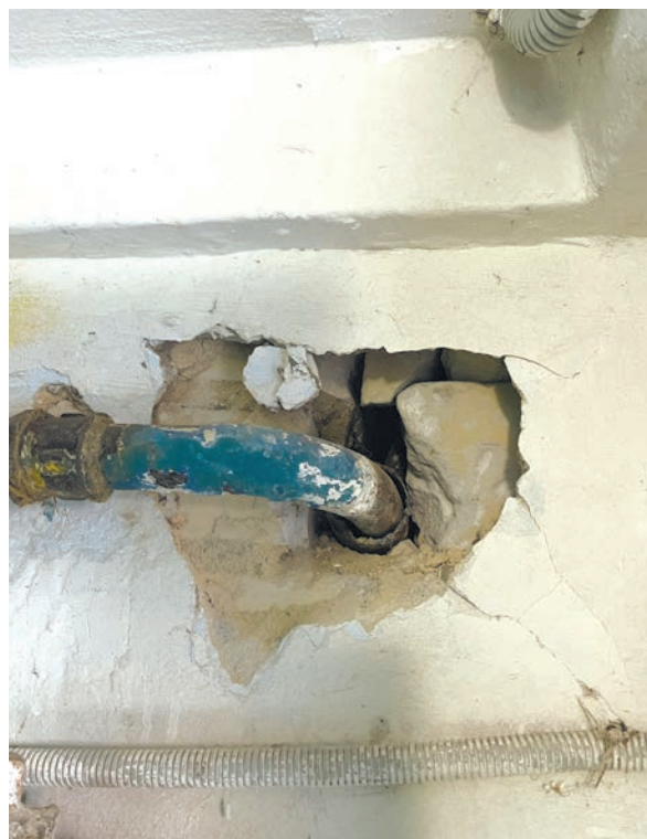
Последствия некачественной работы по замене участка внутридомового газоснабжения (г. Волгоград, ул. Еременко, 25)