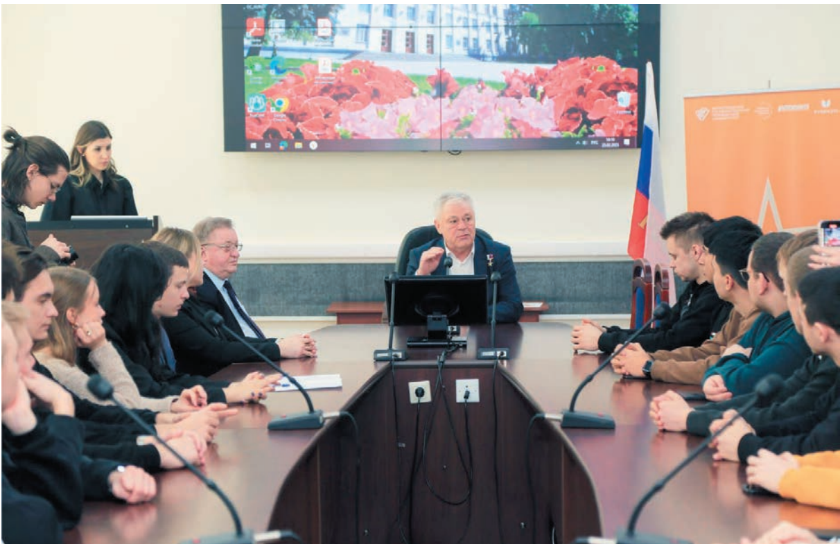
Выступление в ВГУ