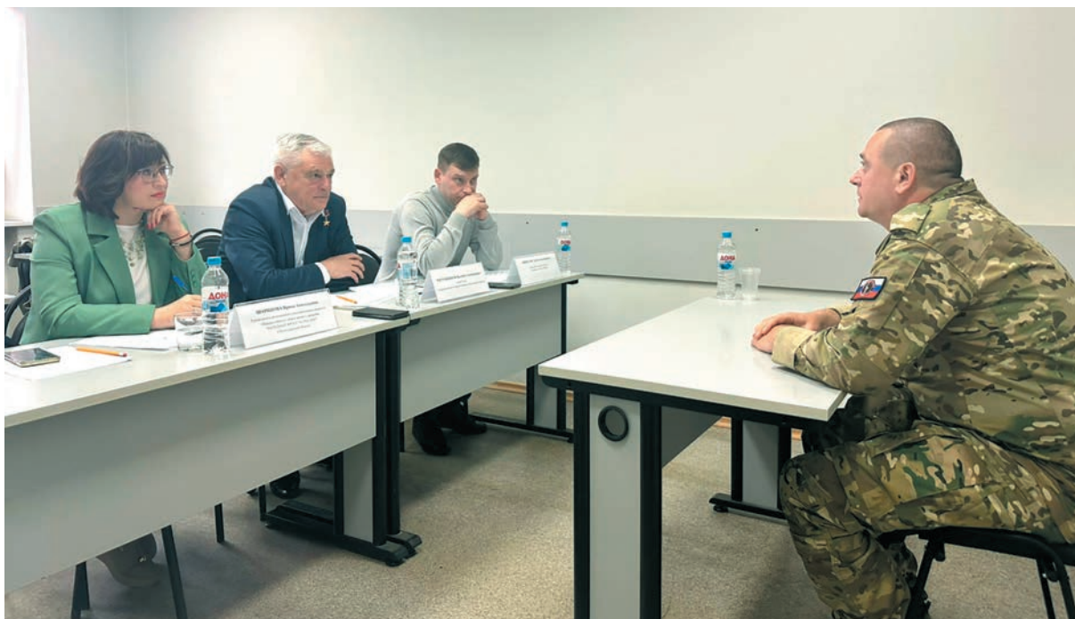
Личный прием военнослужащих - участников СВО совместно с представителями общественных правозащитных организаций