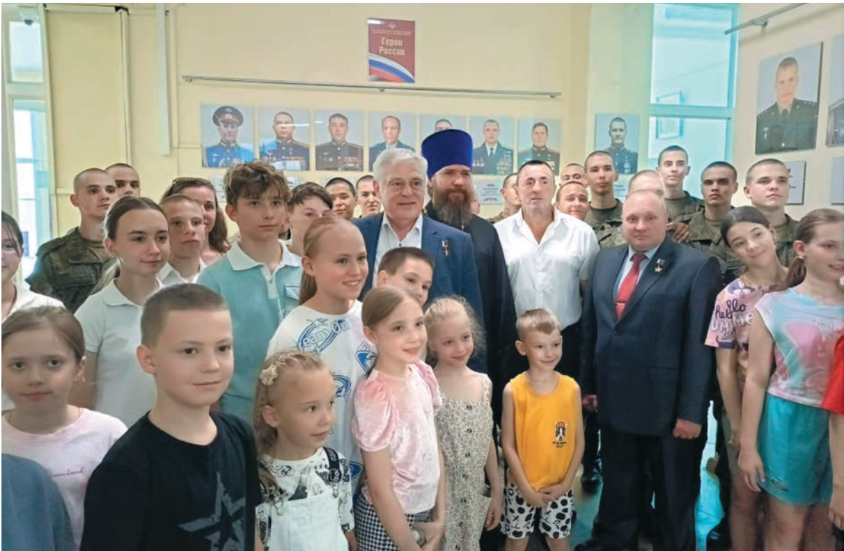
Участие в мероприятии, посвященном 25-летию образования института Уполномоченного по правам человека в Республике Татарстан - июнь 2025 года.