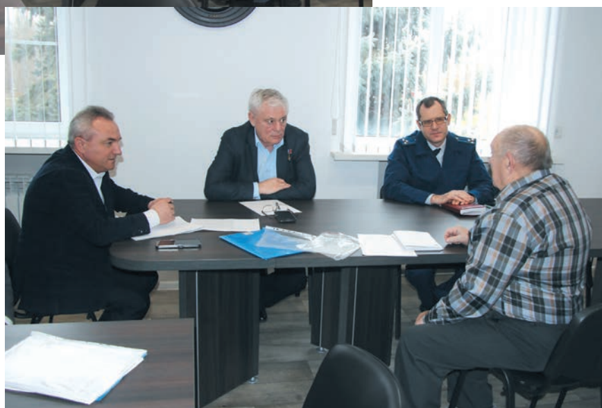
Личный прием граждан в Октябрьском районе