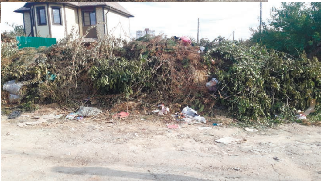
Свалка на пересечении ул. Ульянова и ул. Правды