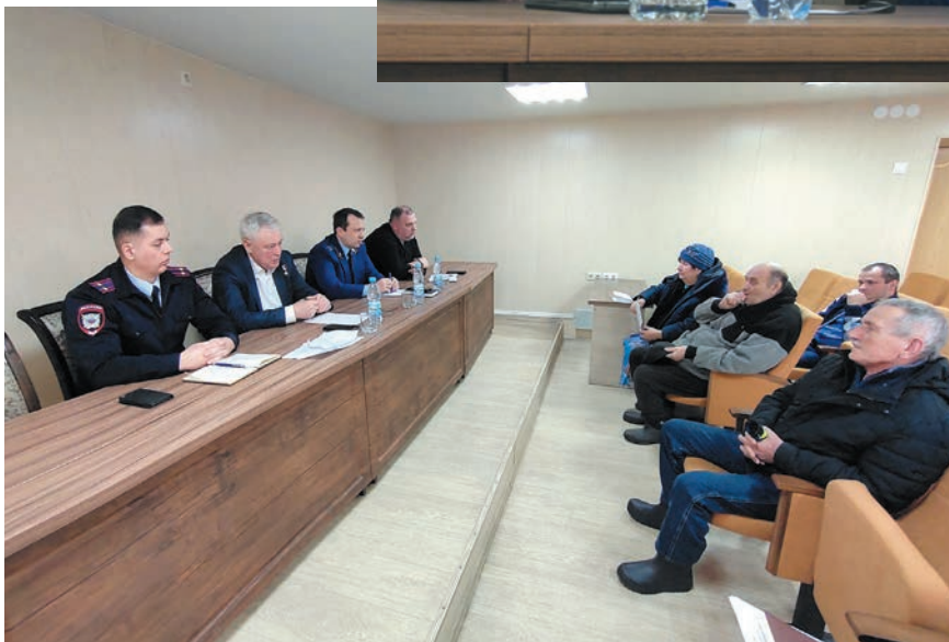
Личный прием граждан в Суворовкинском районе