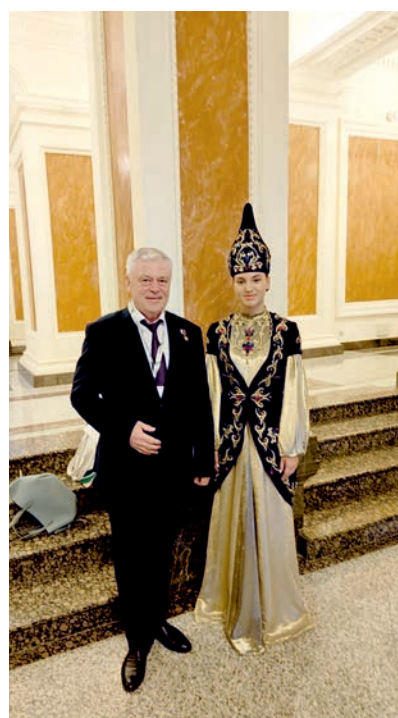
Участие в мероприятии, посвященном 25-летию образования института Уполномоченного по правам человека в Республике Татарстан - июнь 2025 года.