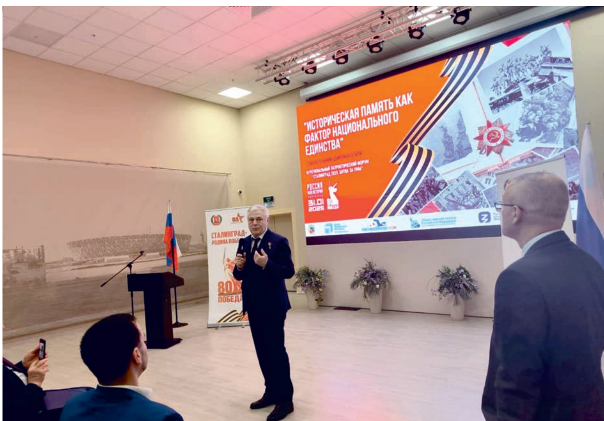
Историческая память - незыблема